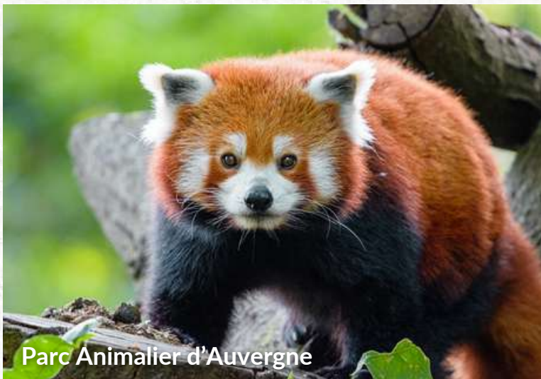
Parc Animalier d'Auvergne