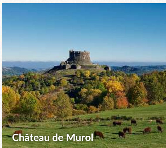
Château de Murol

200 PARTENAIRES HÉBERGEURS qui en proposant ces sorties à leurs clients, leur permettent de bénéficier des -10% dès le 1er site visité !