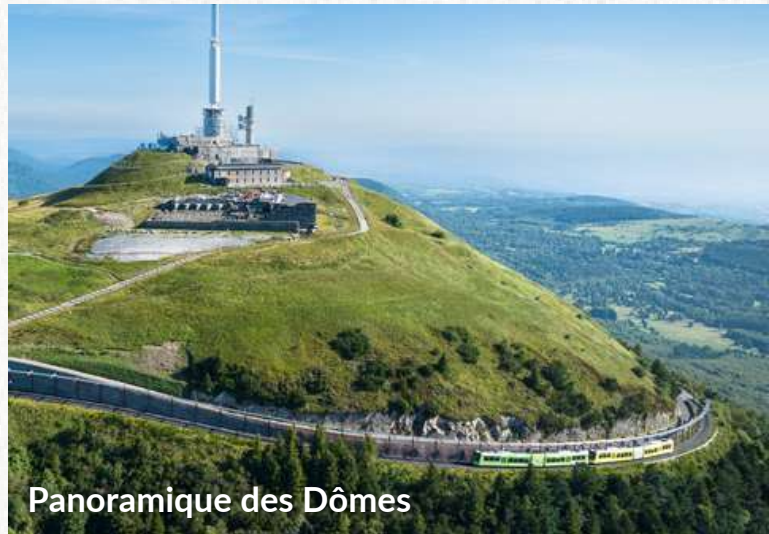
Panoramique des Dômes