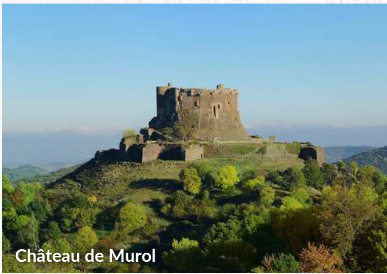
Château de Murol