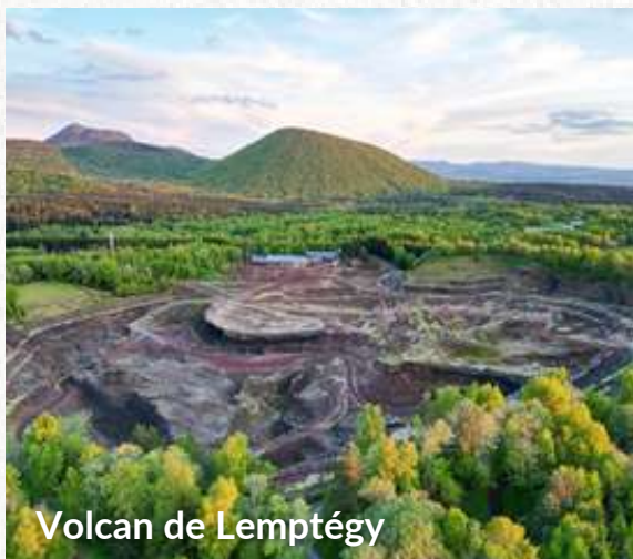
Volcan de Lemptégy

7 SITES TOURISTIQUES MAJEURS réunis au sein d'Objectif Auvergne