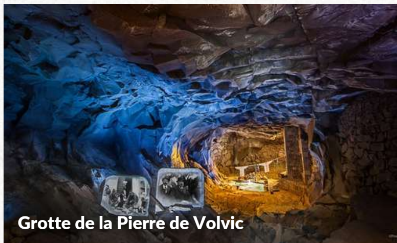
Grotte de la Pierre de Volvic