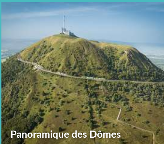
Panoramique des Dômes

PANORAMIQUE DES DÔMES : 387 000 visiteurs