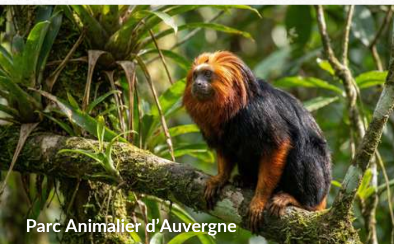
Parc Animalier d'Auvergne