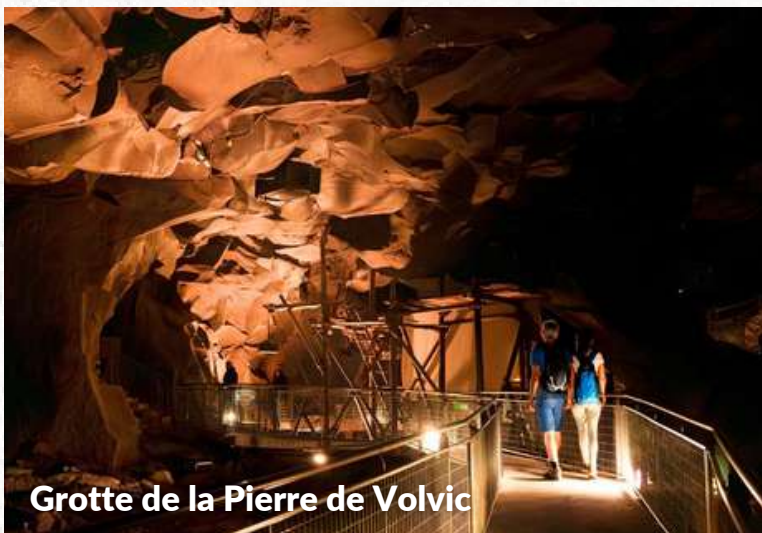
Grotte de la Pierre de Volvic