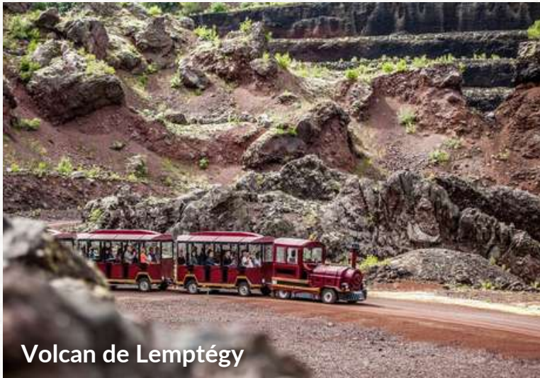
Volcan de Lemptégy